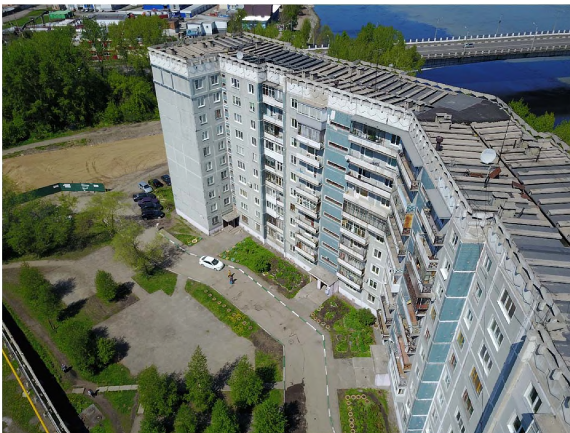
Рис.№3. ОБЩИЙ ВИД ДВОРА В СТОРОНУ пр. Строителей.