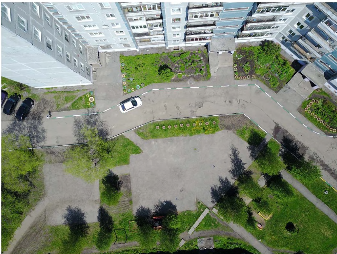
Рис.№2. Вид двора сверху.